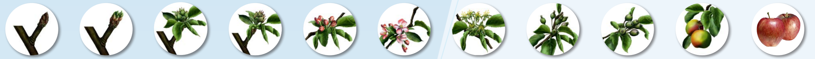
Receso invernal Yema hinchada Puntas verdes Inicio ramillete floral Botón rosado Inicios de flor Plena flor Caída de pétalos Fruto cuajado Fruto 2,5 cms pre-cosecha Pre-cosecha Post-cosecha