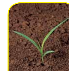
pega - pega

Hoja Ancha: ambrosia, bledo, chamico, malvilla, quingüilla, rábano, sanguinaria, verdolaga y yuyo, entre otras.